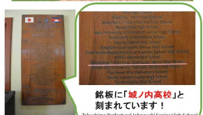
銘板に「城ノ内高校」と刻まれています！ Tokuhashi Prefectural Jahnouchi Senior High School