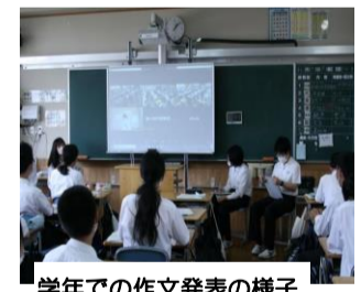
学年での作文発表の様子